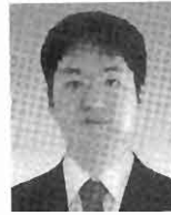
稲見昌彦 (Masahiko Inami)

1946年1月1日生。1968年，東京大学工学部計数工学科卒業，1973年，同大学大学院工学系研究科博士課程修了(工学博士)。東京大学助手，通産省機械技術研究所バイオロボティクス課長，マサチューセッツ工科大学(MIT)客員研究員，東京大学先端科学技術研究センター教授などを経て，1994年，東京大学工学部教授。現在，同大学大学院情報理工学系研究科教授。バイスペクトル分析，盲導犬ロボット，トレイグジスタンス，アールキューブなどの研究を行う。国際計測連合学会(IMEKO)ロボティクス会議議長，重点領域「人工現実感」領域代表，日本バーチャルリアリティ学会初代会長などを務める。(日本ロボット学会正会員)